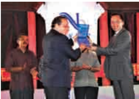
Bekerjasama dengan Yayasan Karya Salemba 4 (KS4) Bank NISP memberikan beasiswa kepada mahasiswa Universitas Andalas, Padang. In cooperation with Yayasan Karya Salemba 4 (KS4) Bank NISP provides scholarship to students of University Andalas, Padang.

Selama tahun 2007 Bank NISP bekerjasama dengan Karya Salemba Empat (KS4) memberikan bantuan untuk mahasiswa yang kurang mampu dalam bentuk pemberian beasiswa untuk biaya hidup maupun pembuatan skripsi pada Universitas Indonesia, IPB (Institut Pertanian Bogor) dan Universitas Andalas, dimana dalam pemberian beasiswa tersebut melalui beberapa tahap salah satunya interview yang dilakukan langsung oleh KS4 dan Bank NISP. Tahap interview tersebut dilakukan secara berkesinambungan dan terakhir dilakukan pada bulan November 2007.