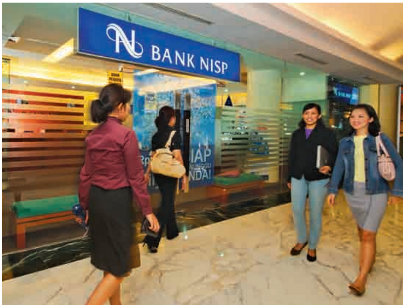
KANTOR WISMA BNI 46, JAKARTA Wisma BNI 46 Office in Jakarta

Bank NISP is committed to provide personal engagement with customers to deliver tailored financial solutions that meet their needs.