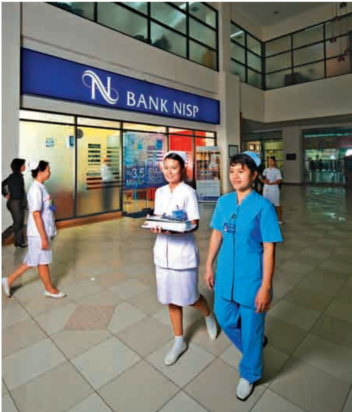
KANTOR RS. BORROMEUS, BANDUNG Borromeus Hospital Office in Bandung

Bank NISP telah menawarkan produk-produk bancassurance kepada para nasabah sejak tahun 2005 dan diperkuat lagi pada tahun 2007 dengan aliansi strategis yang eksklusif.