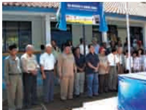
Peresmian Sekolah Dasar Negeri 3 Legok Jawa di Pangandaran Jawa Barat, bantuan Bank NISP bekerjasama dengan Bank OCB-Indonesia dan Harian Umum Pikiran Rakyat. Opening ceremony of Elementary School 3 Legok Jawa in Pangandaran, West Java donated by Bank NISP in cooperation with OCB Bank-Indonesia and Pikiran Rakyat Newspaper.

Throughout 2007, Bank NISP in cooperation with Karya Salemba Empat (KS4), provides scholarship for students from low-income families to cover daily expenses needs or dissertation programs at the University of Indonesia, the Bogor Agricultural University and Andalas University, Padang. Bank NISP, participated in the student selection process by interviewing candidates directly, together with KS4. These interviews were carried out in succession one after another, the last one was in November 2007.