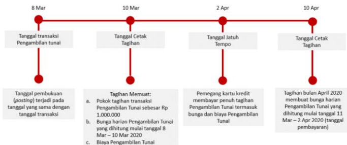
Ilustrasi Perhitungan Bunga Transaksi Tarik Tunai (Cash Advance)

Bunga untuk Pengambilan Tunai (Cash Advance) dibebankan dan dihitung sejak Tanggal Penarikan (Cash Advance) sampai dengan tanggal dilakukannya pembayaran penuh dari transaksi Pengambilan Tunai tersebut. Suku bunga yang berlaku untuk transaksi Pengambilan Tunai tercantum pada Lembar Penagihan. Biaya, denda, ataupun bunga yang belum dibayarkan tidak termasuk dalam komponen perhitungan bunga. Untuk perhitungan bunga secara lengkap dapat dilihat pada ilustrasi Perhitungan Bunga Kartu Kredit.