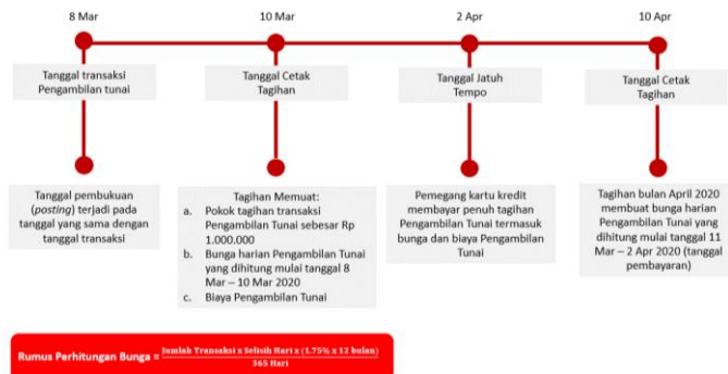
Ilustrasi Perhitungan Bunga Transaksi Tarik Tunai (Cash Advance)

Bunga untuk Pengambilan Tunai (Cash Advance) dibebankan dan dihitung sejak Tanggal Penarikan (Cash Advance) sampai dengan tanggal dilakukannya pembayaran penuh dari transaksi Pengambilan Tunai tersebut. Suku bunga yang berlaku untuk transaksi Pengambilan Tunai tercantum pada Lembar Penagihan. Biaya, denda, ataupun bunga yang belum dibayarkan tidak termasuk dalam komponen perhitungan bunga. Untuk perhitungan bunga secara lengkap dapat dilihat pada ilustrasi Perhitungan Bunga Kartu Kredit.