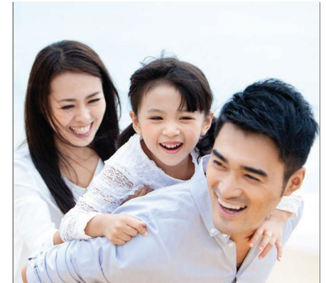
PT Asuransi Allianz Life Indonesia

Produk ini sudah termasuk manfaat tambahan Layanan Bantuan Medis (Medical Assistance)